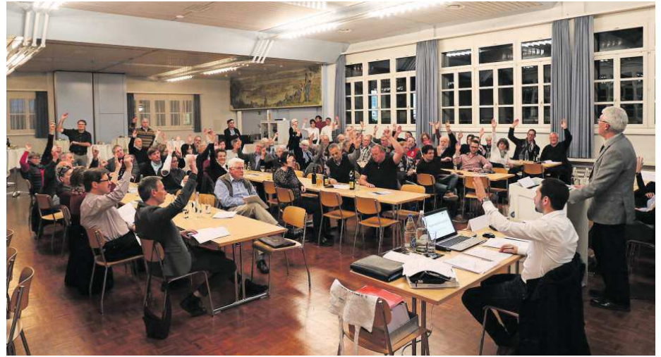
Trotz längerer Diskussionen folgten die Bürgerinnen und Bürger den Anträgen des Stadtrats.

Der Bund verlangt von den Gemeinden, dass diese zuerst eingezontes Bauland nutzen, bevor sie weitere Kulturf Flächen für Verbauungen zur Verfügung stellen. Der Stadtrat hat deshalb entschieden, ein Inventar über die sich ankündigenden Entwicklungsgebiete aufzunehmen und basierend darauf raumplanerische